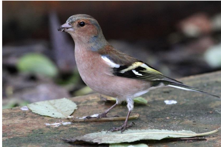
Vink liet zich gewillig fotograferen

De rit naar Olgahafen aan de Dümmersee hadden we ons eigenlijk kunnen besparen. Het was er dusdanig druk met dagjesmensen in verband met het mooie weer dat we amper vogels te zien kregen. Wat meerkoeten, enkele kok- en zilvermeeuwen, twee knobbelzwanen, een dodaars, een groepje kramsvogels, een witte kwikstaart op het dak bij het visrestaurant, een luid zingende winterkoning en grote groepen overtrekkende kolganzen. Dat was het wel zo'n beetje. En: niet te vergeten de huismussen en een vrijwel handtamme vink. De laatste liet zich zelfs gewillig portretteren.