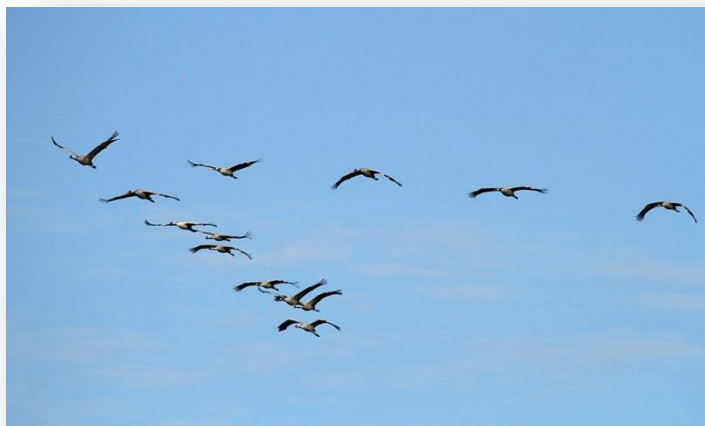
Eerste kleine groepjes kraanvogels

We hadden op dat moment reeds de eerste kleine groepjes kraanvogels in het vizier gekregen, die zich met telescopen, verrekijkers en wat dies meer zij mooi lieten bekijken. Bij het zien en horen van deze eerste statige vogels - met hun imposante "kroekroe" geluiden - is het altijd weer kicken geblazen. Zeer zeker voor de nieuwelingen.