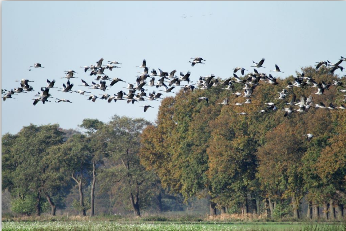
Spectaculaire aantallen kraanvogels in dit gebied

De laatste excursie van 2014 was deze keer voorbehouden aan het Diepholzermoor, nabij Osnabrück en wel op zaterdag 1 november. De excursie was vooral gericht op de spectaculaire kraanvogelaantallen in dit gebied.