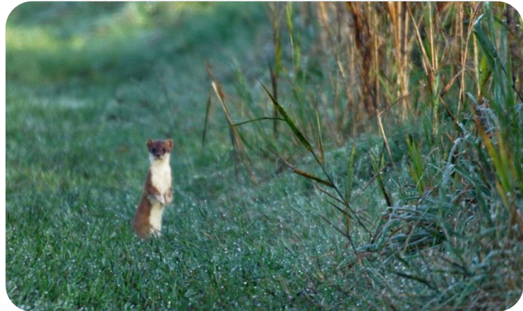
Een poserende hermelijn

shots, maar was de fotografen toch enigszins ter wille door even te poseren. Jammer genoeg zijn dit soort momenten vaak slechts van zeer korte duur. Een blik op het display van één der camera's wees kort daarna uit dat deze nog stond afgestemd op vliegbeelden; kortom alle hermelijnfoto's waren te sterk overbelicht en konden meteen de prullenbak in. Balen dus. Gelukkig zijn er gelijktijdig meer opnames gemaakt, zodat we dit verslag toch nog kunnen verlevendigen met een afbeelding van dit oh zo interessante roofdiertje.