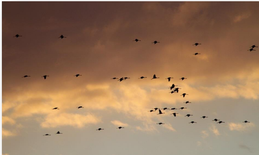
Van kilometers ver zijn ze te horen

De groepen, zeg liever slierten kraanvogels, die hierna volgden, vlogen vaak ver van ons af en streken veel verder neer dan op voorhand gedacht. We moesten het dan ook vooral hebben van de trompetterende geluiden van deze dieren. Van kilometers ver zijn ze namelijk al te horen. Nochtans kwam er ook menige groep pal over ons heen en hoorden we geregeld kolganzen over komen, die net als de kraanvogels een slaapplekje opzochten in het veen.