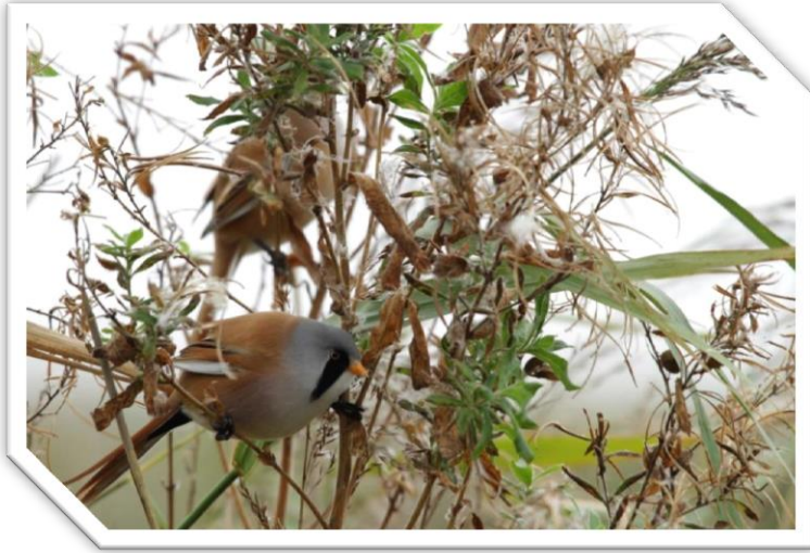
Baardmannetjes, gezien vanaf het observatiepunt

eenden en aalscholvers nog enkele leuke watervogelsoorten te ontdekken. Dat leverde 2 brilduikers (beide mannetjes) en een 5 tal Grote zaagbekken (4 mannetjes en 1 wijfje) op. Verder zaten hier enkele knobbelzwanen, 10-tallen futen, alsmede wat kuif-, tafel-, slob- en krakeenden. Geruime tijd werd tevergeefs de omgeving afgespeurd naar eventuele zeearenden. Uiteindelijk wist onze voorzitter er niet één, maar zelfs twee, gezeten in een boom, op te sporen.