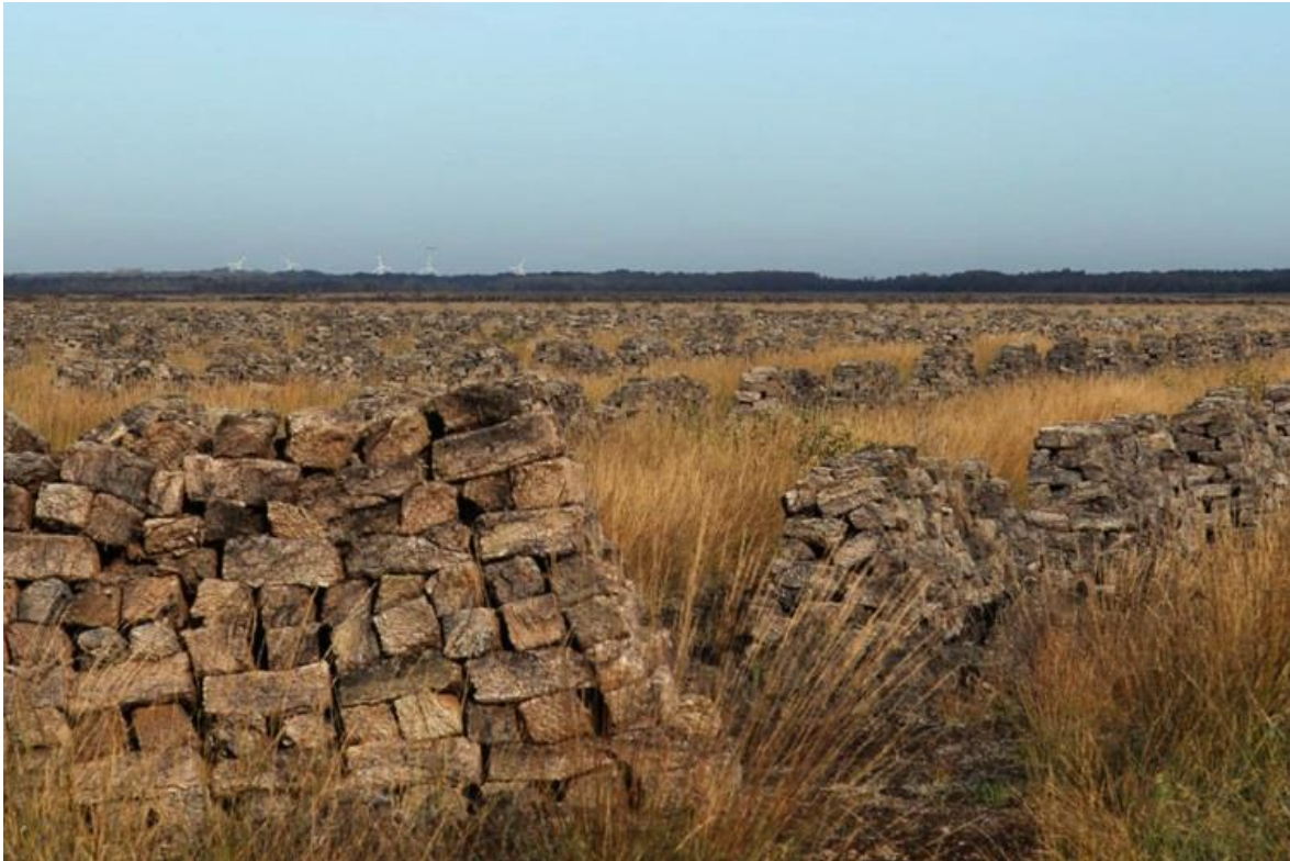
Enorme hoeveelheid turf