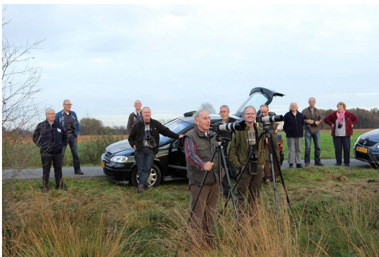
We kozen een rustig plekje uit

Het slotakkoord voor die dag was als te doen gebruikelijk gepland nabij Diepholtz in het Rehdener Geestmoor. Wijd en zijd is bekend dat daar veel kraanvogels overnachten. Het aanvliegen naar deze slaappleatsen, waar ook een grote uitkijktoren is gebouwd, wordt door veel mensen bekeken. Ze komen er zelfs met bussen vol naartoe. Als je een goede plek op dit uitkijkpunt wilt hebben mag je er wel twee uur van tevoren gaan staan.