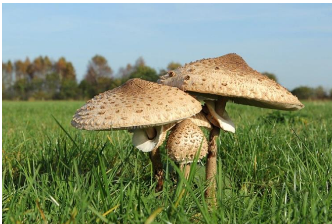
Drieluik grote parasolzwam

Met een paddenstoelliefhebber aan boord mocht een drieluik van de grote parasolzwam natuurlijk ook niet ontbreken.