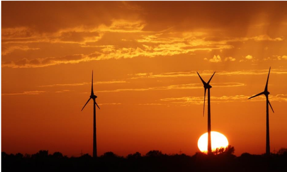
Ondergaande zon met windmolens